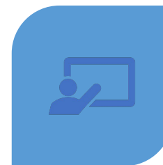
RELIGIÓN / ATENCIÓN EDUCATIVA