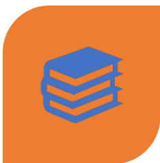
MATERIAS COMUNES OBLIGATORIAS