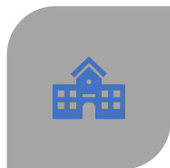
MATERIAS OPTATIVAS (A ELEGIR 3)